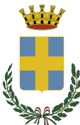
Comune di Conegliano