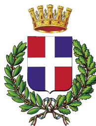
Comune di Vittorio Veneto