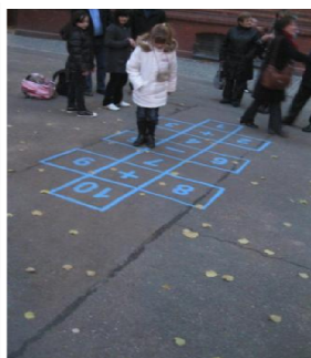
Giochi per strada a Berlino

Il viaggio a Berlino che ha visto giornate spunti e proposte da portare nelle nostre e che ci ha dato nuova energia per continuare ci ha dato la possibilità di intensificare