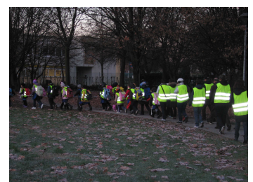
I nuovi Piedibussini di Vazzola

i plessi del centro, di Fossamerlo e di Zoppè. Altre hanno già espresso la loro volontà di esserci...ma vi sveleremo i loro nomi nel prossimo numero!